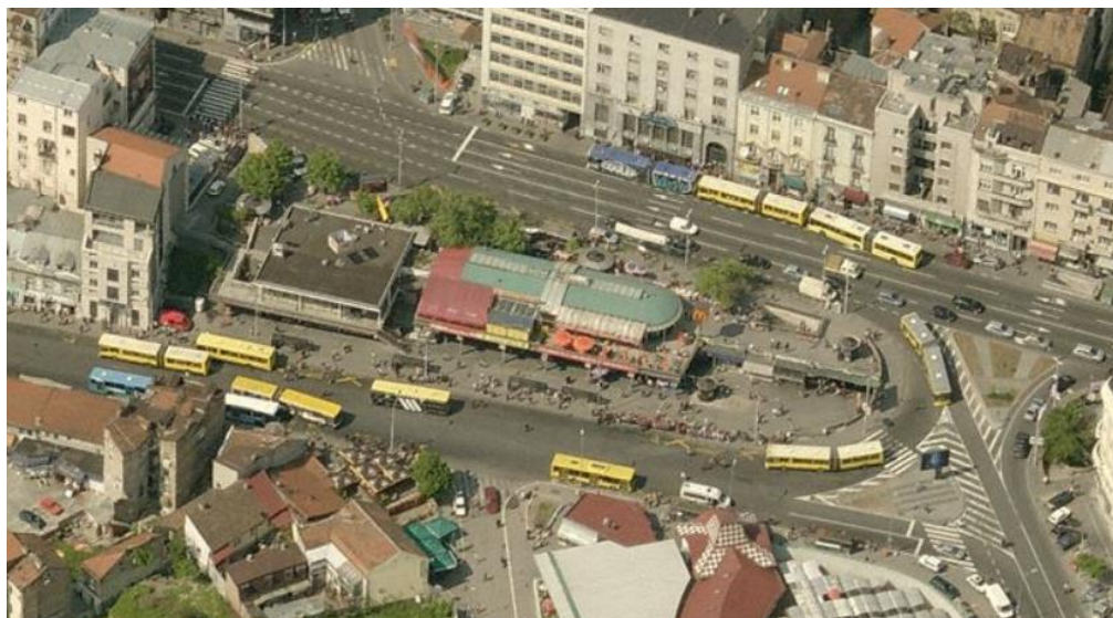
Слика 1. Део блока између ул.Бранкове и Југ Богданове

Постојећи начин коришћења земљишта приказан је на графичком прилогу 2. Постојећа намена површина у Р 1:500.