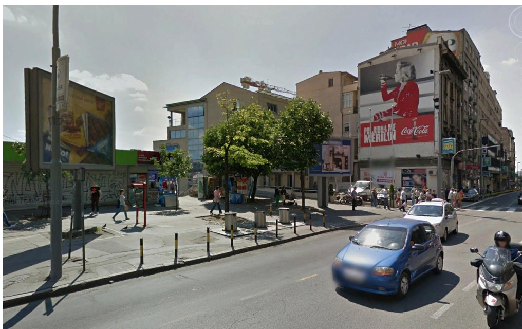
Слика 4. Суседни објекти у Бранковој улици