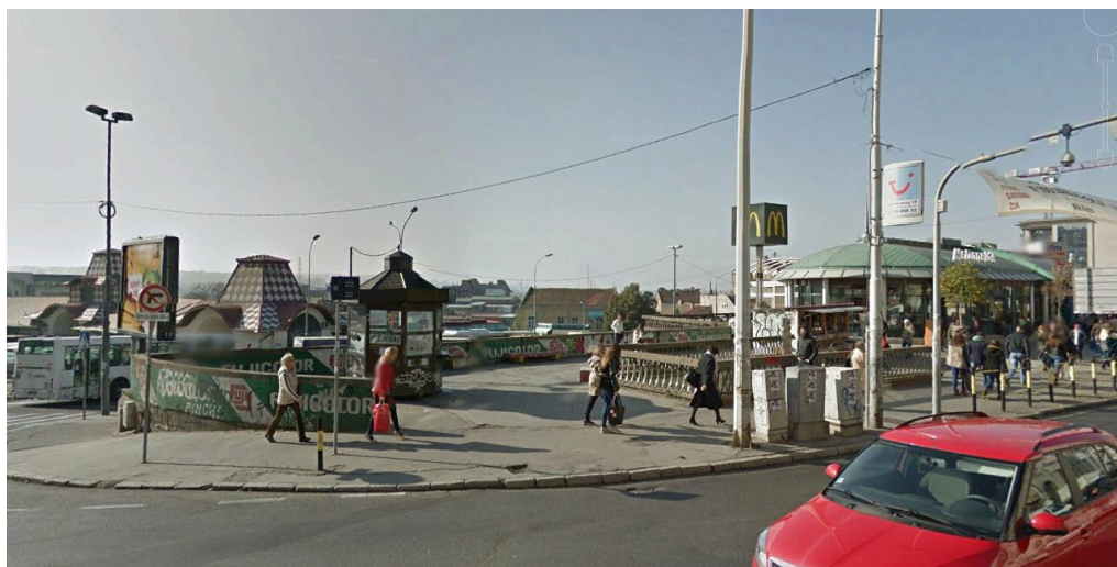
Слика 3. Угао ул. Бранкова и Зелени венац