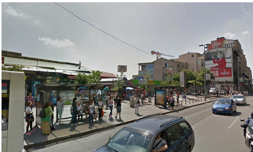
Слика 2. Стајалишта јавног градског превоза у Бранковој улици