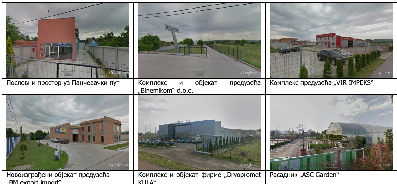
Слика 3: Постојећи објекти комерцијалне намене

У оквиру ове зоне се налази већи број објеката комерцијалних садржаја (пословање, угоститељство, стоваришта грађевинског материјала, дистрибутивни центри, сервиси и сл.), са изграђеним слободностојећим објектима. Спратност објеката је од П до П+1 (преовлађују објекти спратности П+1, релативно доброг бонитета (као што су предузећа Дрвопромет „KULA“, VIR IMPEKS, VM export import, Фирма Vinemikom d.o.o. и др.), са уређеним слободним површинама на парцели. Поред наведених објеката, у оквиру ове зоне се налазе и Расадики „ASC Garden“, Двориште за откуп секундарних сировина „Darkomatic“ d.o.o., Дом за стара лица „Сигуран живот“, локали и угоститељски објекти. Већина објеката је изграђена у оквиру припадајуће катастарске парцеле. Објекти су углавном повучени од регулационе линије, са предњим и задњим двориштем, слободностојећи, са задовољавајућим бочним растојањем између објеката. Приступ објектима је са саобраћајнице Панчевачки пут, индиректно преко сервисних саобраћајница, као и преко постојећих колско-пешачких стаза између саобраћајнице и одбрамбеног насипа и Канала „Каловита“. Просечан индекс изграђености на парцели је око „и“=0.4 (од 0.2 до 0.6), а просечан индекс заузетости „з“=0.3 (од 0.15 до 0.5).