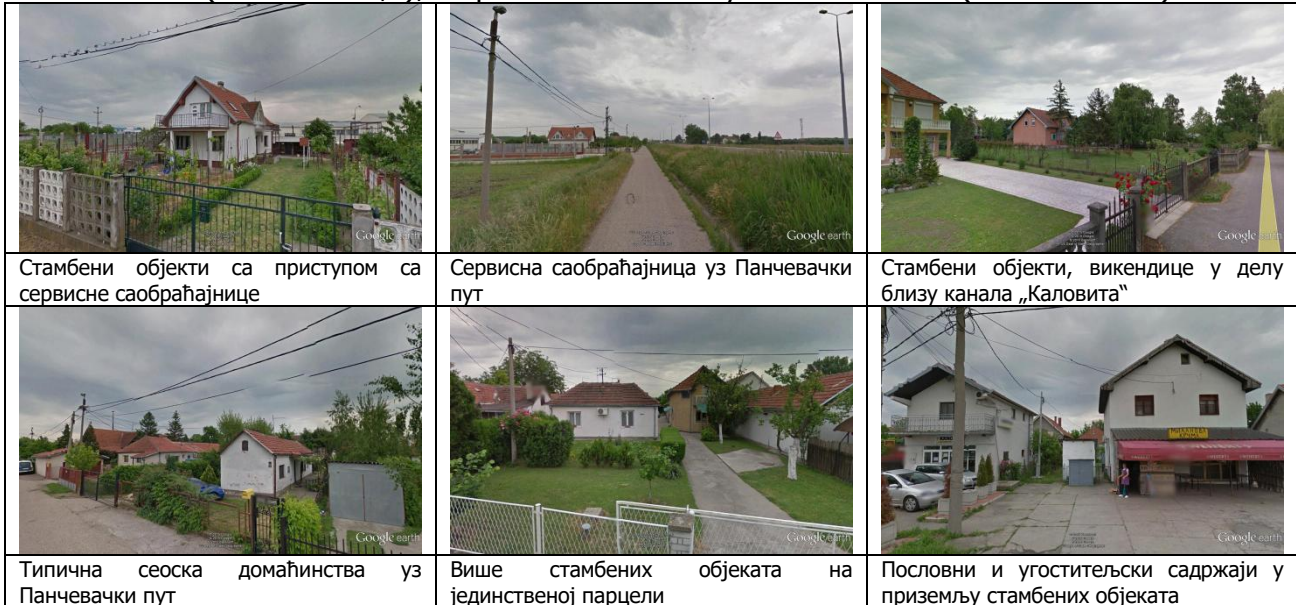
Слика 4: Постојећи стамбени објекти

су у већини неплански грађени. У неким од објеката се у приземљу налазе пословни и угоститељски садржаји. Објекти су релативно доброг бонитета, спратности П - П+1+Пк. Приступ објектима је са саобраћајнице Панчевачки пут, индиректно преко сервисних саобраћајница, као и преко постојећих колско-пешачких стаза између саобраћајнице и одбрамбеног насипа и Канала „Каловита“. Просечан индекс изграђености на парцели је око „и“=0.2 (од 0.09 до 0,3), а просечан индекс заузетости „з“=0.1 (од 0.05 до 0.2).