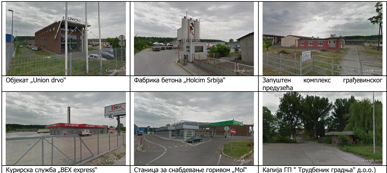
Слика 1: Постојећи објекти привреде

Спратност објеката је од П до П+1 (преовлађују објекти спратности П са различитим висинама у зависности од технолошког процеса), релативно лошег бонитета (односи се претежно на комплексе грађевинских предузећа ГП "7.јули" а.д. Београд и ГП "Трудбеник градња" д.о.о.), са неуређеним слободним површинама на парцели.