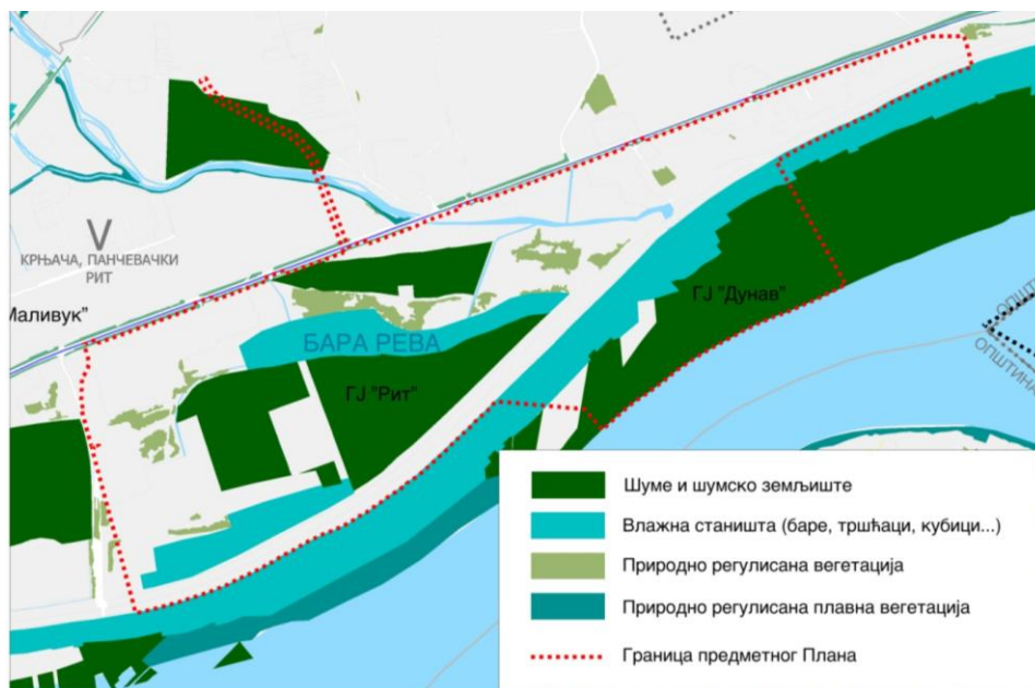
Слика 5 – Постојеће шуме и природно регулисана вегетација

На површини од око 68ha предметног подручја егзистирају влажна станишта (баре, тршћаци, и др.), бара „Рева“ и кубаци, обраста вегетацијом карактеристичном за станишне услове. Део предметног подручја обрастао је природно регулисаном вегетацијом различитог стадијума сукцесије (шуме и шибљаци). (Слика 5)