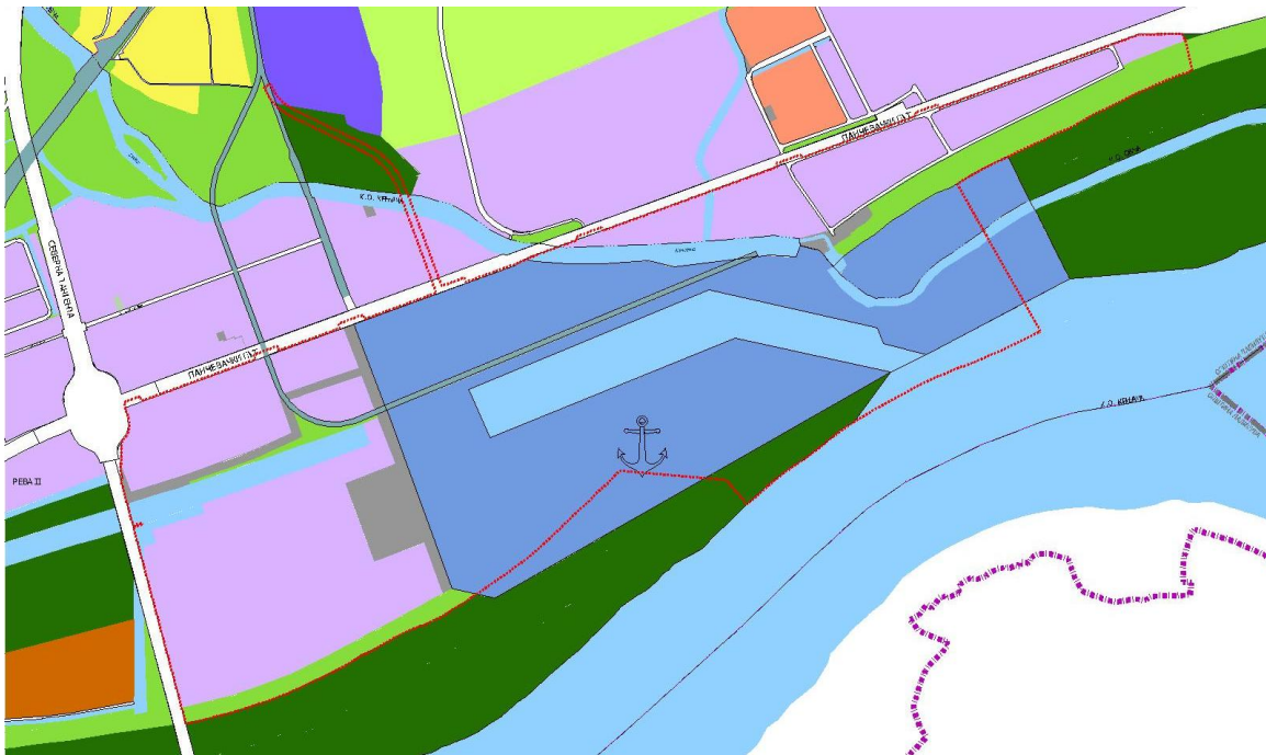
Слика 6– Извод из планиране намене земљишта ПГР грађевинског подручја Београда

Привредна зона „Панчевачки рит“ налази се у периферној зони града. Једна је једна од највећих привредних зона Београда. На овом подручју се обављају расноврсне привредне активности: графичка, металска, хемијска, електрограђевинска, складиштење, нафтна индустрија и друге. Зона је делимично опремљена инфраструктуром и највећи је проблем канализација која је везана за каналисање отпадних вода банатске стране Београда. Изградњом савременог пута Београд - Панчево и правца за Румунију улога ове зоне је знатно увећана. Планирани просторни обухват зоне се заснива на ширењу дуж Панчевачког пута и у дубину ка железничкој станици Овча. У оквиру ове зоне планирана је већа површина за нову луку и мултимодални чвор на обали Дунава, са базеном за пристајање бродова у функцији привреде и бродарства. У саставу нове Луке Београд планира се изградња терминала за расуте терете. Уз планирани терминал за расуте терете, планиране су и нове привредне зоне.