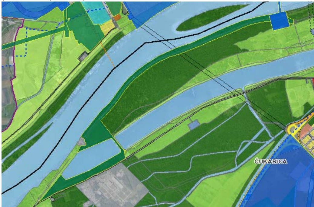
Слика2. Обухват Измене и допуне на Плану генералне регулације-план намене површина

Према ПГР-у грађевинског подручја седишта јединице локалне самоуправе - Град Београд, ово подручје се налази у зони шуме