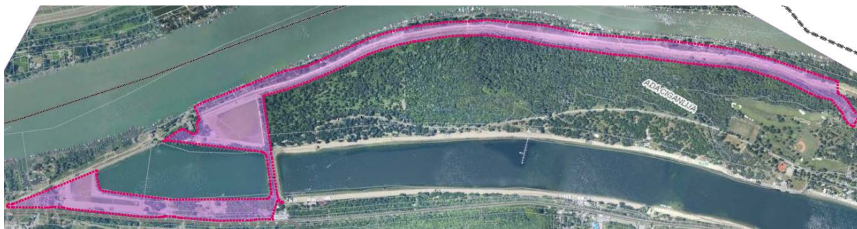
Слика1. Ортофото снимак са обухватом Измене и допуне

Овим Материјалом за рани јавни увид утврђује се оквирна, односно прелиминарна граница обухвата Измене и допуне Плана, а коначна граница обухвата ће се дефинисати Нацртом Измене и допуне плана.