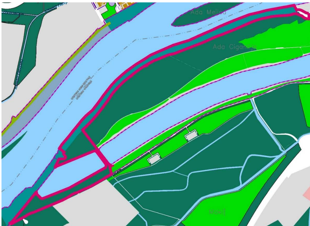
Слика3. Обухват Измене и допуне на ПГР-у система зелених површина Београда намена површина

Према ПГР-у система зелених површина Београда предметно подручје се налази у површинама јавне намене - шуме и шумско земљиште и јавним зеленим површинама - зелене површине у приобаљу Дунава и Саве.