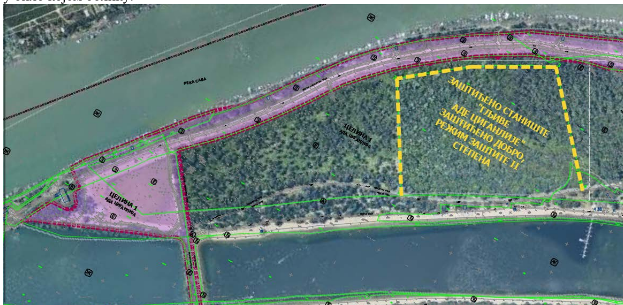
Слика 4. Локација заштићеног подручја „Гљиве Аде Циганлије“

На простору обухвата Плана нема заштићених подручја, ни осталих просторних целина од значаја за очување биодиверзитета. У непосредној близини обухвата се налази подручје заштићеног станишта „Гљиве Аде Циганлије“ (Сл.лист града Београда, број 57/13), где су забрањене шумарске интервенције, кретање посетилаца ван обележених стаза, као и уништавање флоре, фауне и фунгије у било којем облику.