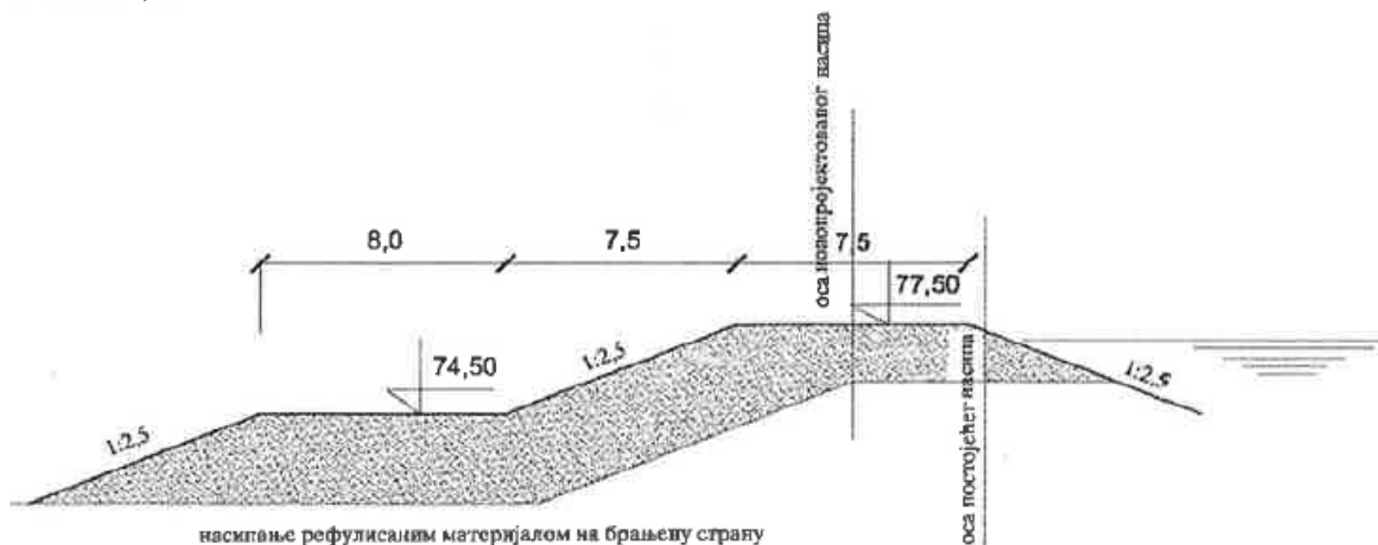
Слика 3. попречни пресек са карактеристичним димензијама земљаног насипа

Подручје третирано предметном изменом је неизграђено, у оквиру ког се претежно неуређене зелене или земљане површине. Одбрамбени насип је функционалан, који одржава ЈВП Србијаводе, а према подацима добијеним у току сарадње током припрем Одлуке за израду предметног ПДР-а, локација је дефинисана на оријентационој стационажи од км 6+000 до км 9+500 према току Саве и на оријентационој стационажи од км 3+000 до км 7+000 деснообалног реконструисаног савског насипа дуж Аде Циганлије. Реконструкција, надвиђење насипа, је извршено на брањеној страни. Кота круне насипа од низводне преграде до шпица Аде је на коти 77,00мнм, док је од шпица до узводне преграде, на којој је предвиђено извођење радова, кота круне насипа за пола метра већа (око 77,50мнм).